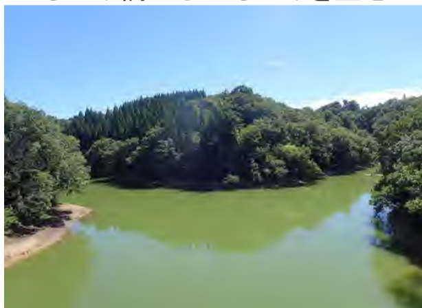
かもいけ橋からかもいけを望む