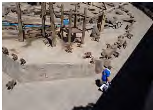
おやつタイムのサルたち