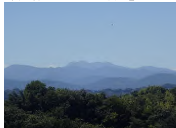
中央林道から白山方面を望む