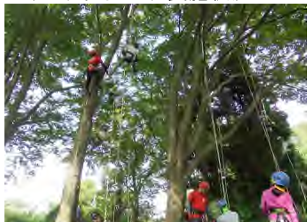
ツリークライミング実施状況