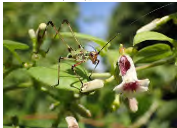
ヘクソカズラの花と虫