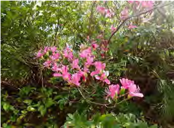
ユキグニミツバツツジ