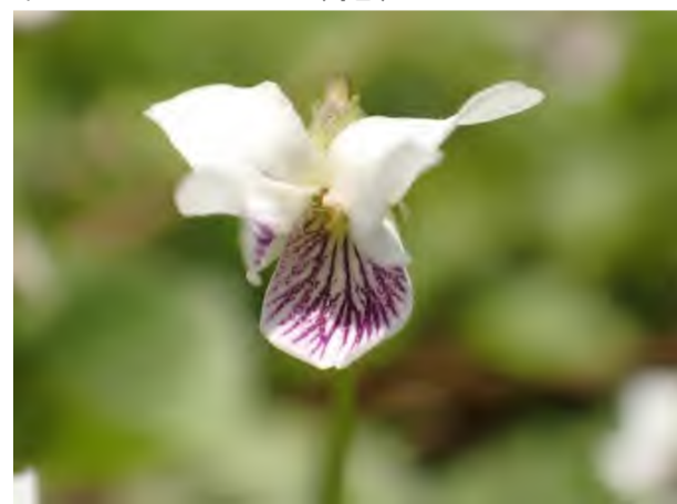
ケマルバスミレ(花)