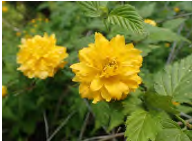
ヤマブキ(やまぶきの道)